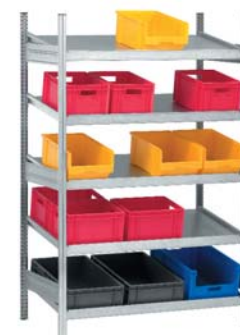
Feldtiefe: 600 mm