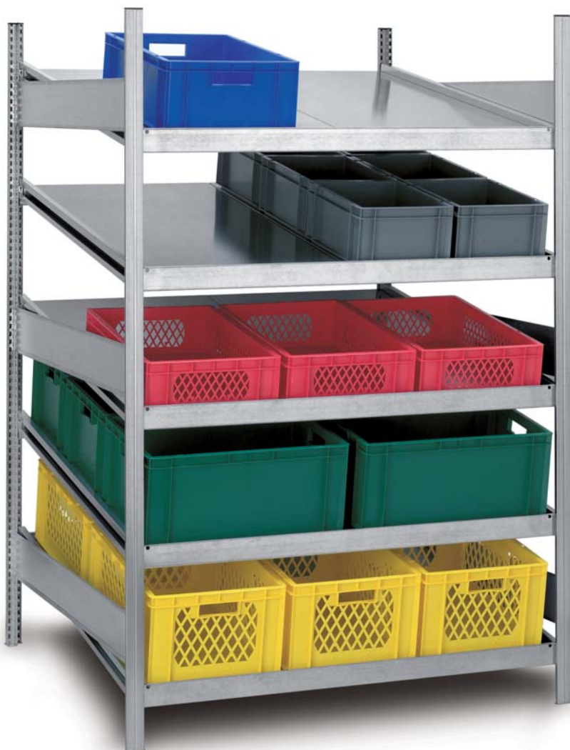
Feldtiefe: 1200 mm