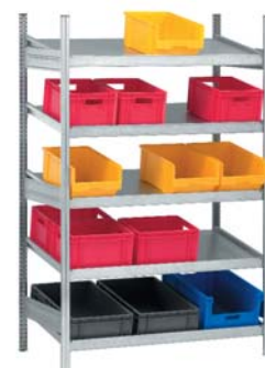
Feldtiefe: 600 mm