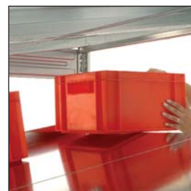
Einfaches Beschicken der Regale nach dem FIFO-Prinzip.