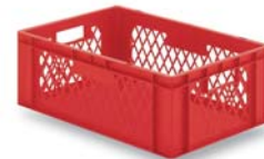
Behälter HB 62100 und HB 62101 mit Grifföffnung.