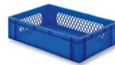
Behälter HB 61450 und HB 61451 ohne Grifföffnung.