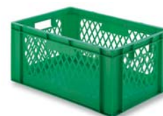
Behälter HB 62700 und HB 62701 mit Grifföffnung.