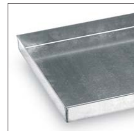
Wannenboden mit Sicherheitsaufkantungen.